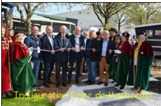
Inauguration Foire de Machecoul