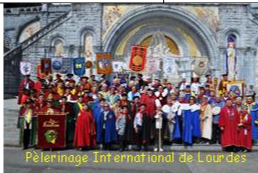
Pèlerinage International de Lourdes