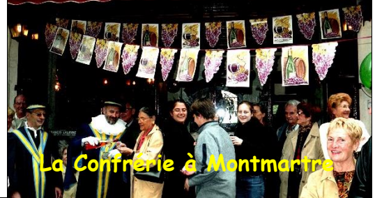
La Confrérie à Montmartre