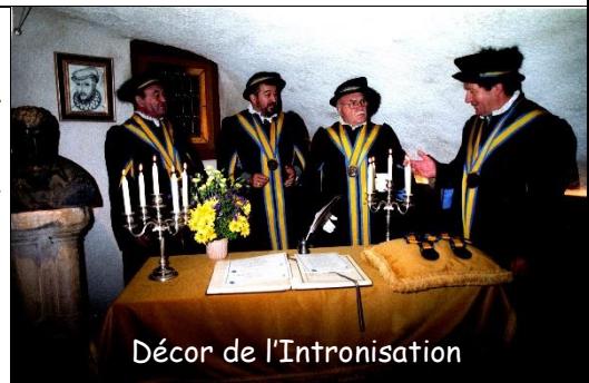
Décor de l'Intronisation

La Confrérie des Compagnons de Joachim du Bellay a été créée en 1975 à Liré, village natal de ce Grand poète du XVIème siècle qui a si bien chanté son petit Lyré, la Loire et sa douceur angevine. Notre tenue porte les couleurs de la famille du Bellay et notre médaille est à l'effigie du poète.