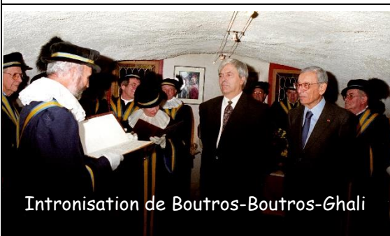
Intronisation de Boutros-Boutros-Ghali